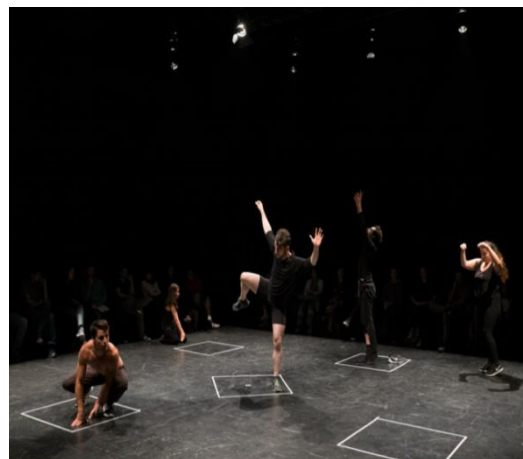
IMAGEN 2: Didáctica del M2 registro investigación aplicada

Nuestra hipótesis es que al trasladar el comportamiento del cuerpo humano a un espacio mínimo de expresión y comunicación, se resignifica la relación con el cuerpo como primer territorio habitado, promoviendo la autoría corporal consciente, expuesta convivialmente como un dispositivo escénico. Escenarios individuales personalizados, relacionados entre sí por un problema que los impacta y del cual, como colectivo se toma la decisión de hacerse cargo.