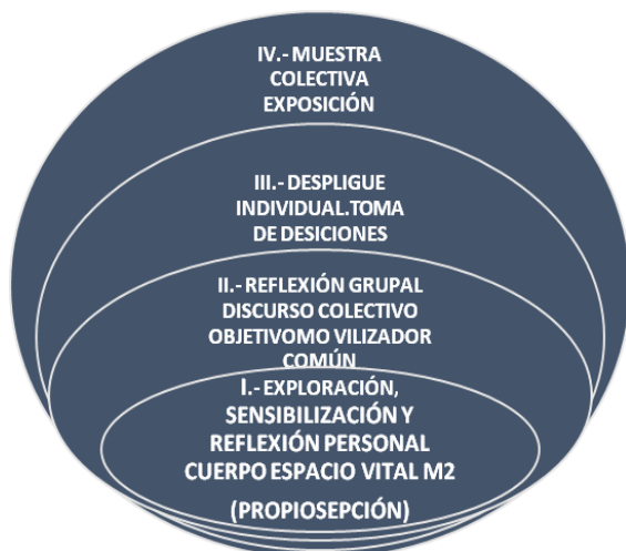
IMAGEN 3: Fases de la Didáctica del M2

Exposición de Discursos en M2. Creaciones en Relieves. Mini escenarios de presentación colectiva. Obras, Universos. Geografías personales en una topografía del encuadre. Implica la transferencia de la experiencia- acción.