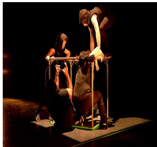
IMAGEN 4: “Al Cubo... transgresiones a propósito de lo Humano”

consciente o inconscientemente el ser humano está a diario conviviendo con su espacio vital, permanentemente tensado y/o agredido respecto de sí mismo, de otros cuerpos y sus respectivos M2.