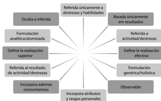
Figura 1. Dimensões para diferenciar concepções de competência [Blanco, 2008, p. 35].

Nesta linha, todo trabalho de robótica em uma escola exige que haja um plano de formação para quem vai mediar estes desempenhos e para isso é possível explicitar duas grandes chaves (RUIZ e PARÉS, 2005): (a) atuar autonomamente – habilidade para defender um argumento; e (b) usar ferramentas interativamente – habilidade para usar o conhecimento, a informação, a tecnologia, a linguagem e os símbolos. E sob tal ótica, (BLANCO, 2008) adaptou algumas dimensões para explicar quais são as bases que devem ser consideradas no processo formativo e que são atributos inerentes especificamente à pessoa para depois serem atribuídas ao profissional.