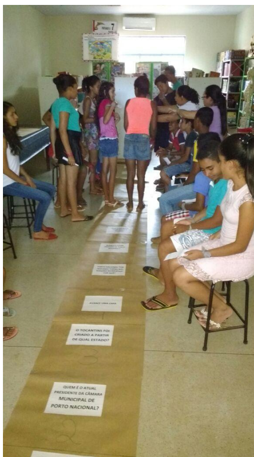
Figura 1 – Oficina trilha geográfica

Primeiro Dia: realizamos em sala de aula a oficina Trilha Geográfica, primeiramente elaboramos a trilha geográfica no LEGEO – Laboratório de pesquisas em metodologia e práticas de ensino de Geografia da UFT – Universidade Federal do Tocantins, Campus Porto Nacional, com perguntas relacionadas a questão política, nas três esferas de poder, o municipal, estadual e federal. Questões relacionadas ao estado do Tocantins, ao município e ao funcionamento do executivo e do legislativo municipal e estadual. E posteriormente fizemos a oficina na escola conforme figura 1.