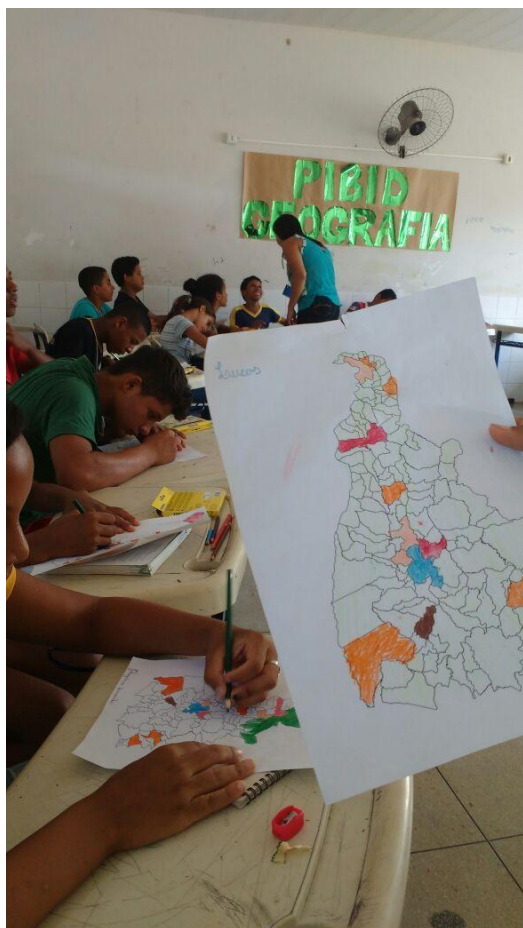
Figura 2 – Confeção do mapa político do Tocantins

Segundo dia: fizemos uma breve apresentação sobre o tema, de início apresentamos o mapa mundi, mapa do Brasil e mapa do estado do Tocantins, realizamos um mapa político dos municípios do estado juntamente com os alunos (figura 2), aplicando os conhecimentos políticos, populacionais e cartográficos, os alunos pintaram os mapas de acordo com o que propomos (figura 3). Após finalizarmos fizemos uma breve análise sobre o que foi feito, tiramos as dúvidas e terminamos com algumas considerações relacionadas ao tema.