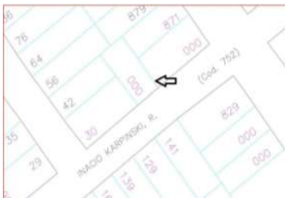
Figura 3. Erro na base e dados comparada com a situação em campo

Tendo em vista em como é o processo de obtenção de numeração predial, foram realizadas as análises comparativas entre as vias verificadas em campo com seu devido registro na base de dados municipal. Nesta comparação, verificou-se que, em alguns casos o banco de dados está desatualizado (Figura 3) e possui alguns equívocos como: Erros de digitalização; Implantação da informação em local errado; Falta de informação; Superposição de dados; Informação fora de padrão adotado (tamanho, espessura e cor).