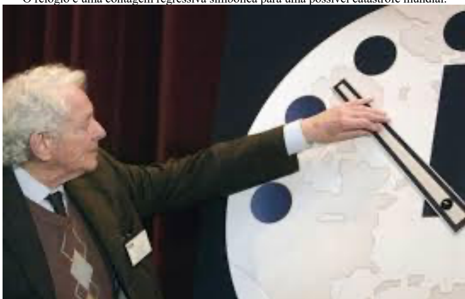
Figura 2. SD 2: Cientistas devem acertar “Relógio do Apocalipse” na sexta-feira O relógio é uma contagem regressiva simbólica para uma possível catástrofe mundial.

Nesse sentido, afastando-se da ingenuidade da coincidência, compreende-se, assim como Soares (2025a, p. 158), “que o discurso necessariamente precisa ser confrontado com suas condições de produção, ou seja, a historicidade a partir da qual os sentidos acarretam efeitos”. De outro modo, Ideias para adiar o fim do mundo é uma resposta às condições de produção nas quais os direitos dos povos indígenas estavam sendo retirados mediante a gestão presidencial de Jair Messias Bolsonaro (2018/2022), com o pretexto de “promover direitos iguais aos povos indígenas”. A obra literária, portanto, se constrói a partir do discurso antagônico e ressignifica o sintagma “fim do mundo” como o apagamento da identidade indígena e o distanciamento entre homem e natureza. Após o exame de uma fração das redes de dizeres literários sobre o fim, passa-se a analisar esse mesmo discurso no campo midiático. No entanto, cabe ressaltar que na SD 2, esses efeitos de sentido se entrecruzam com outro também arquipotente, a saber, o discurso científico.