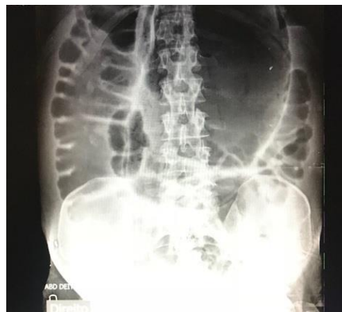
Figura 1: Radiografia de abdome evidenciando dilatação colônica difusa e suspeita de volvo de sigmoide

No ato operatório foi identificada dilatação importante de todo o cólon, sem ponto de obstrução mecânica, com diâmetro do ceco maior que 10 centímetros e sem dilatação de intestino delgado. Por conta do quadro de iminente rotura do ceco e devido à presença de múltiplas áreas sugestivas de sofrimento de alça intestinal, optou-se por realizar colectomia total e maturação de ileostomia terminal. (Figura 2).