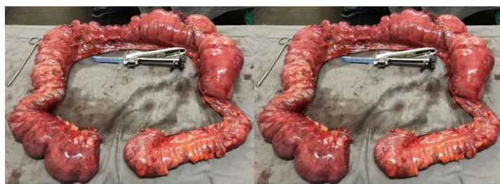
Figura 2: Peça cirúrgica: Cólon (intestino grosso), evidenciando dilatação difusa do órgão e do ceco, além de sinais de sofrimento isquêmico da parede intestinal.

O paciente evoluiu no pós-operatório com manutenção do quadro de distensão abdominal (íleo paralítico prolongado), ileostomia não funcionando e baixa aceitação da dieta via oral sendo, portanto, iniciada dieta parenteral. Ele manteve-se restrito ao leito, sonolento, apático, hipocorado e com fala arrastada. O paciente evoluiu novamente com desconforto respiratório e hipoxemia, sendo necessária ventilação mecânica invasiva e internação em leito de Unidade de Terapia Intensiva (UTI). Fez uso de inúmeros esquemas antimicrobianos por conta de sepse de foco pulmonar.