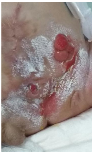
Figura 2. Foto aos 4 meses de idade, após correção cirúrgica. Apresentando áreas de dermatite tópica devido excreção urinária. Regiões brancas devido pomada protetora.