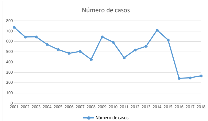
Gráfico 1. Relação em número de casos por ano no período de 2001 a 2018 no estado do Tocantins.

No período de janeiro de 2001 a dezembro de 2018 no estado do Tocantins foram diagnosticados 9367 casos de LTA. Sendo sua maior taxa no ano de 2001, com 737 casos e a menor em 2016, com 243 casos (Gráfico 1).