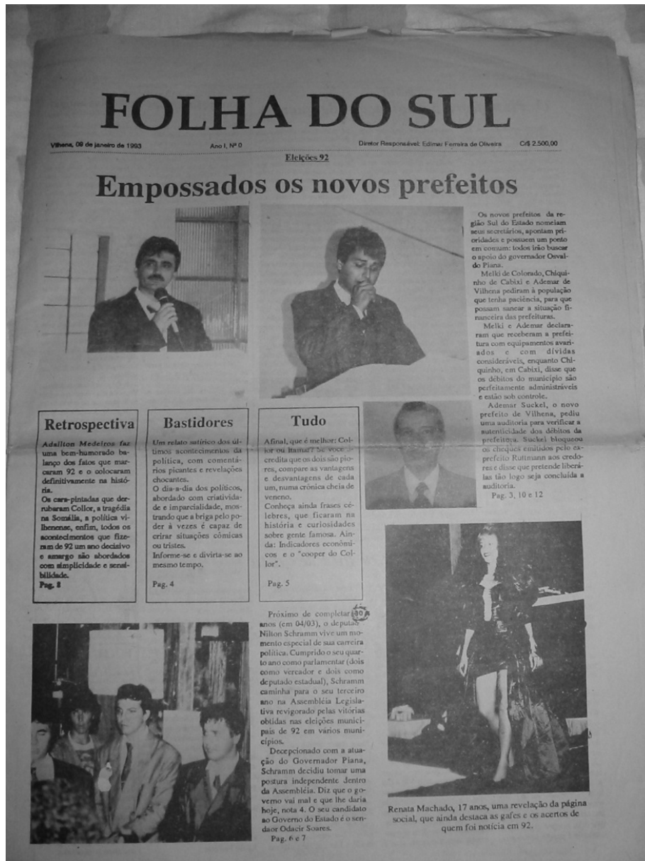
IMAGEM 10 – FOLHA DO SUL

Ainda que tenha se organizado com uma estrutura profissional ao longo de sua primeira década de existência e se mantenha como uma das publicações