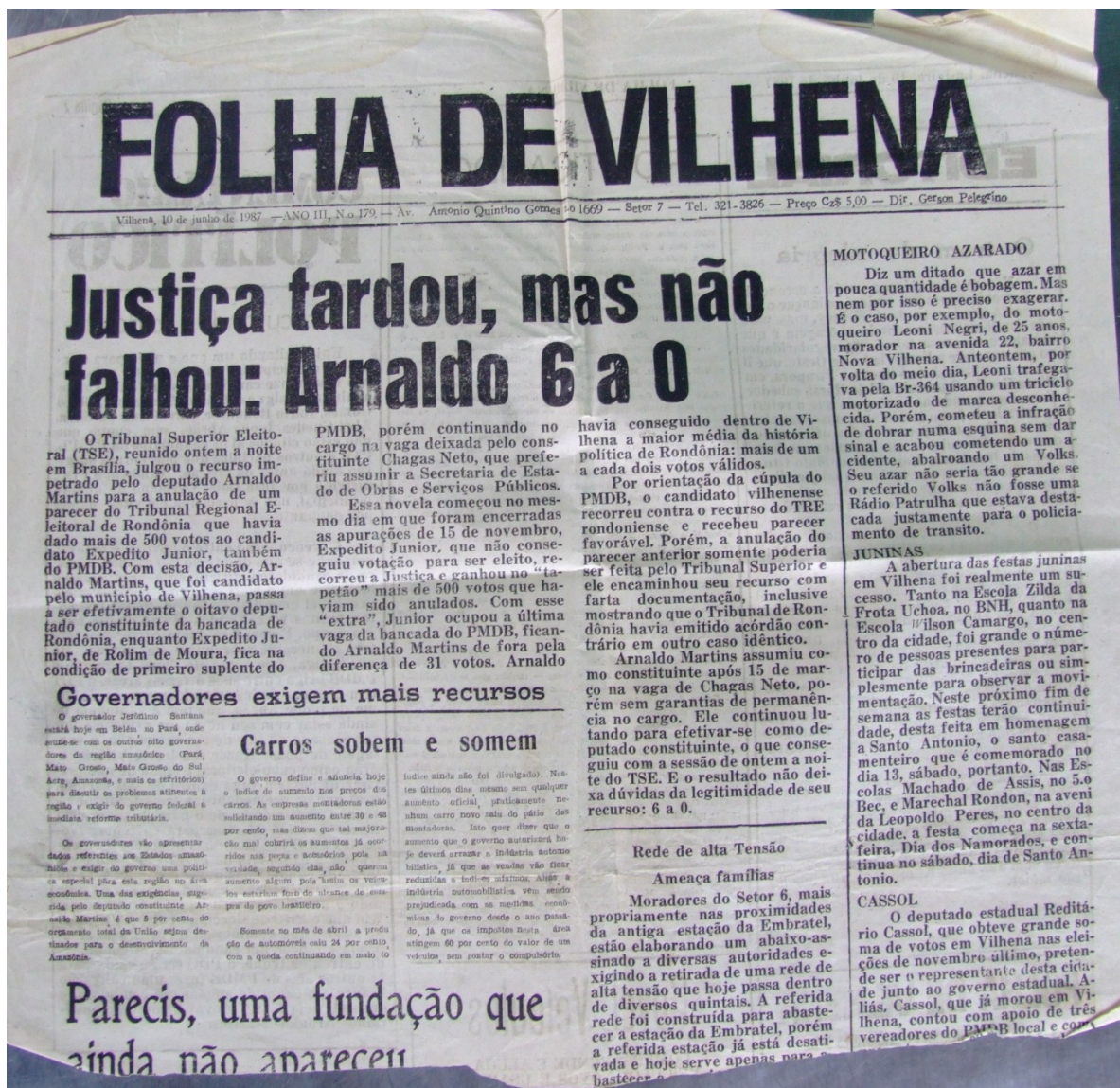
IMAGEM 4 – FOLHA DE VILHENA