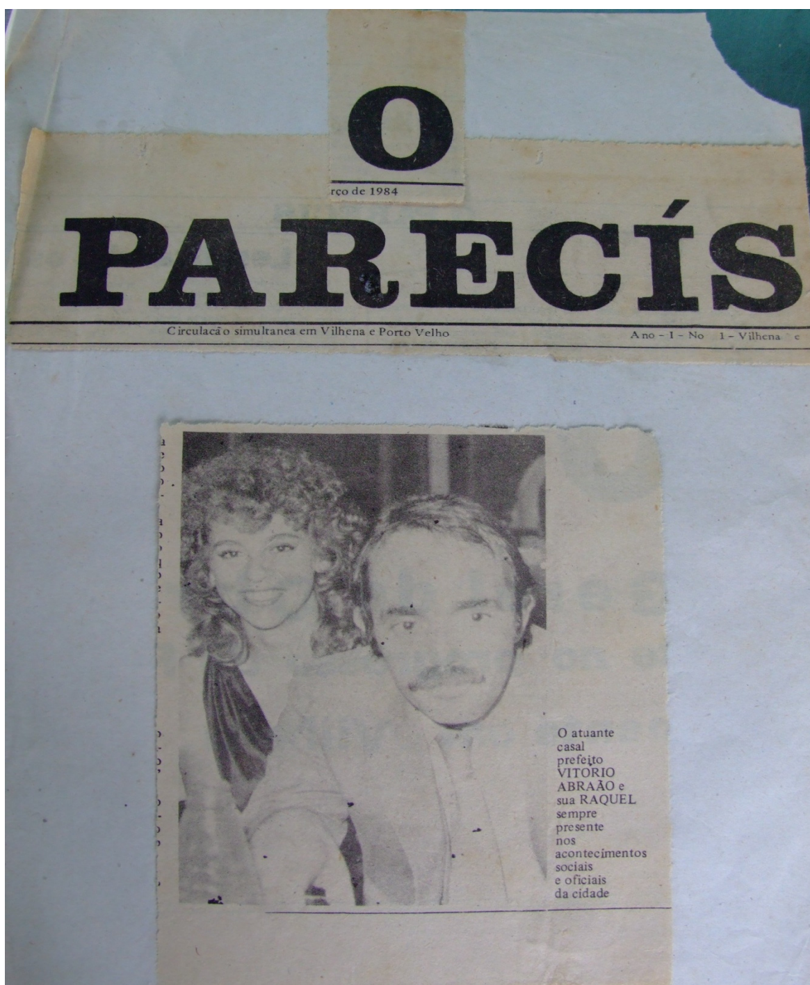
IMAGEM 6 - JORNAL PARECIS