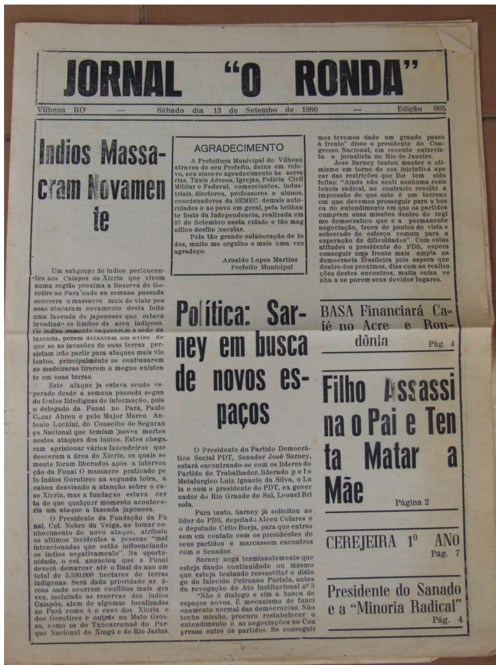
IMAGEM 2 - JORNAL RONDA