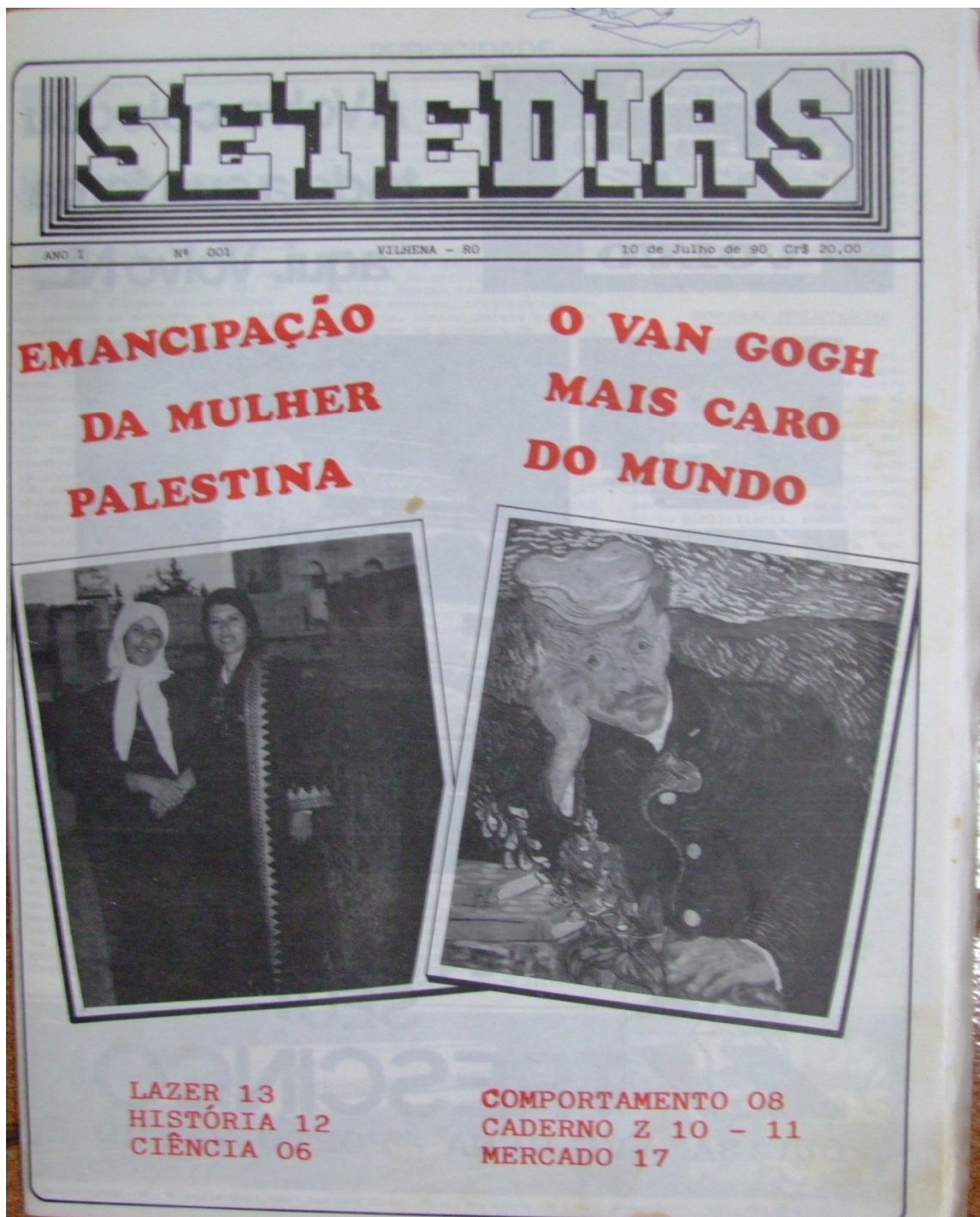
IMAGEM 9 – SETEDIAS