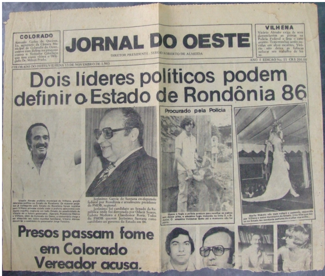
IMAGEM 7 - JORNAL DO OESTE