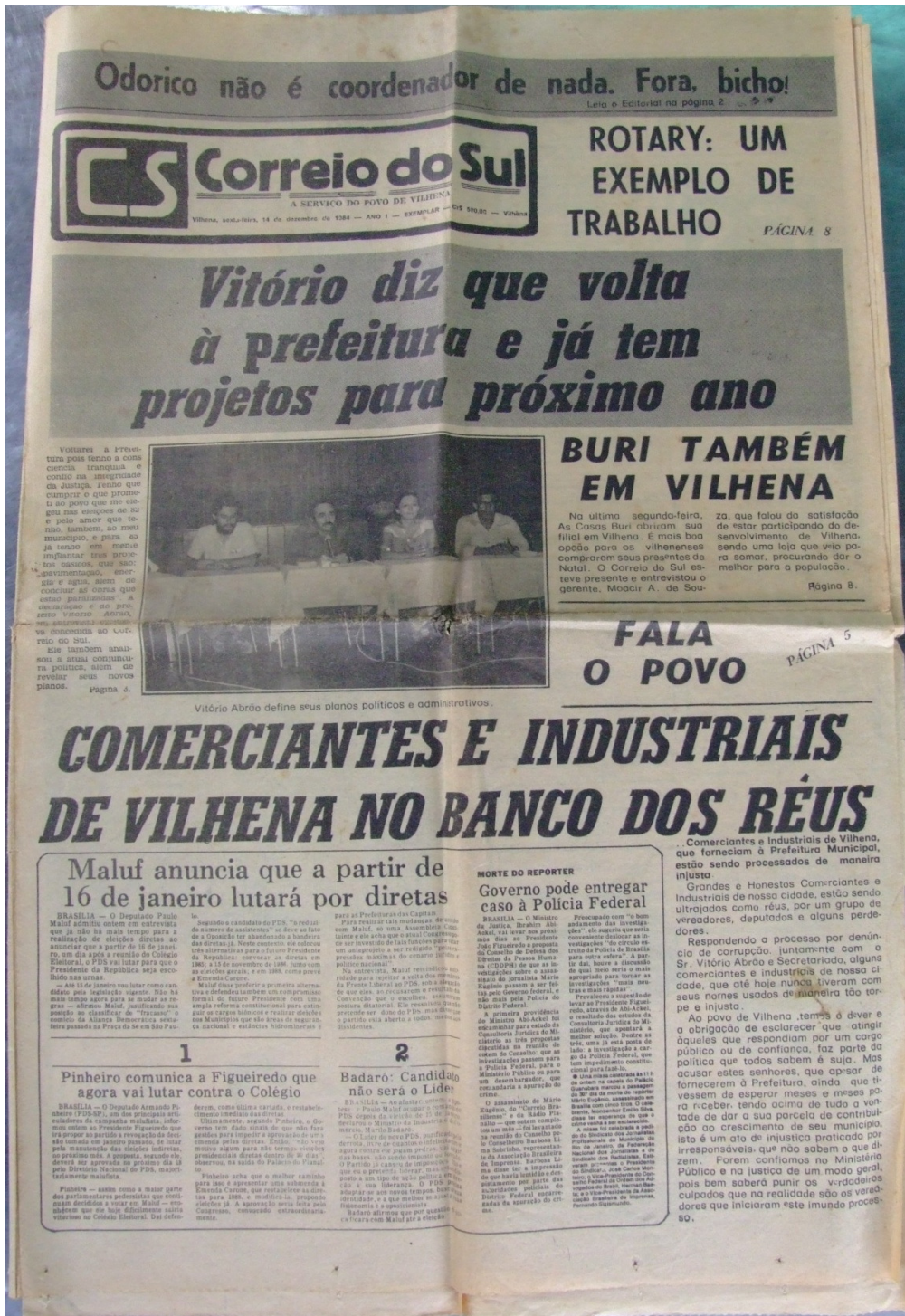
IMAGEM 3 - JORNAL CORREIO DO SUL