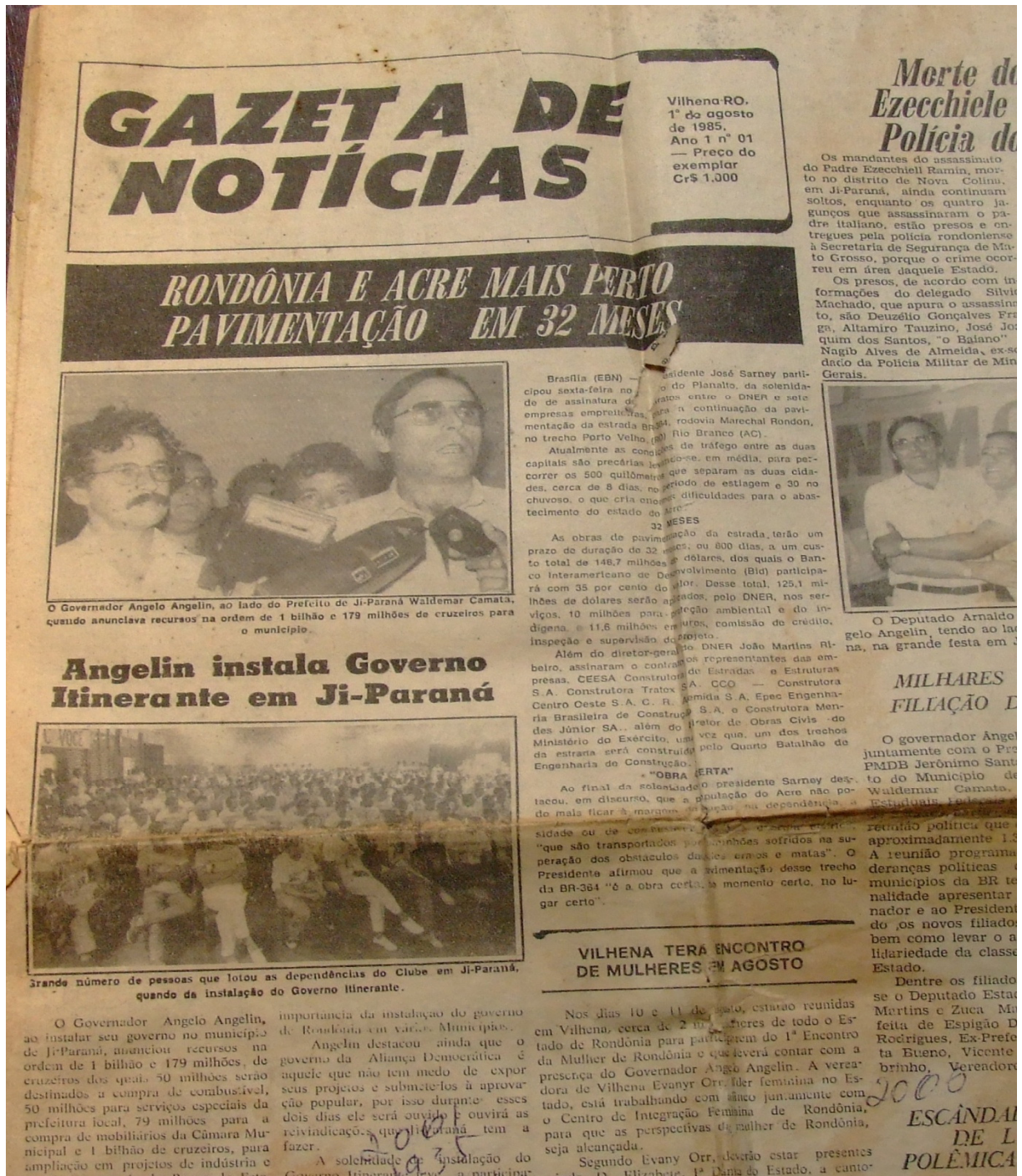
IMAGEM 8 – GAZETA DE NOTÍCIAS