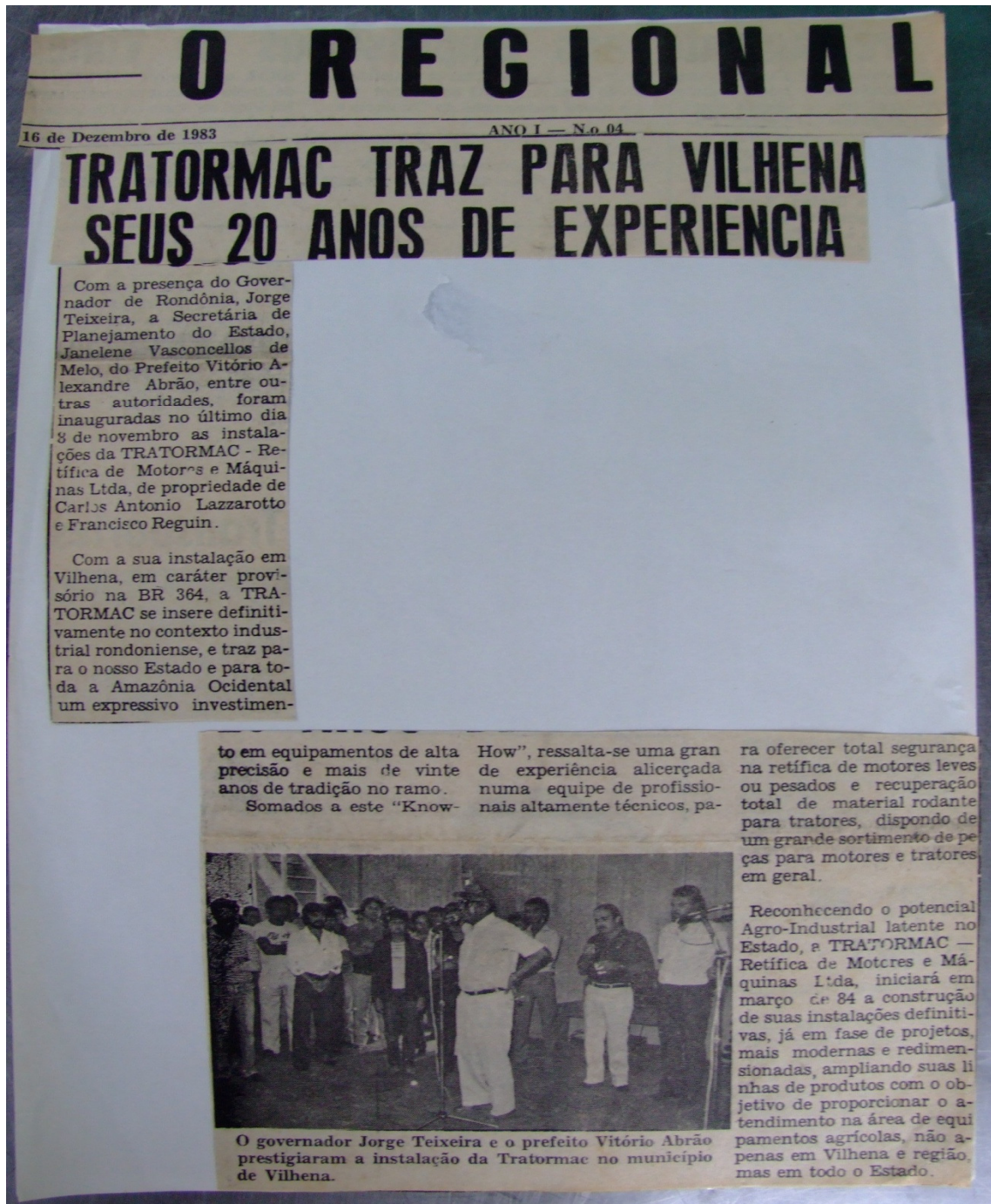
IMAGEM 5 - JORNAL REGIONAL