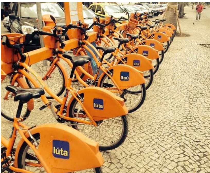
Figura 2 – Ação do coletivo #issomudaomundo