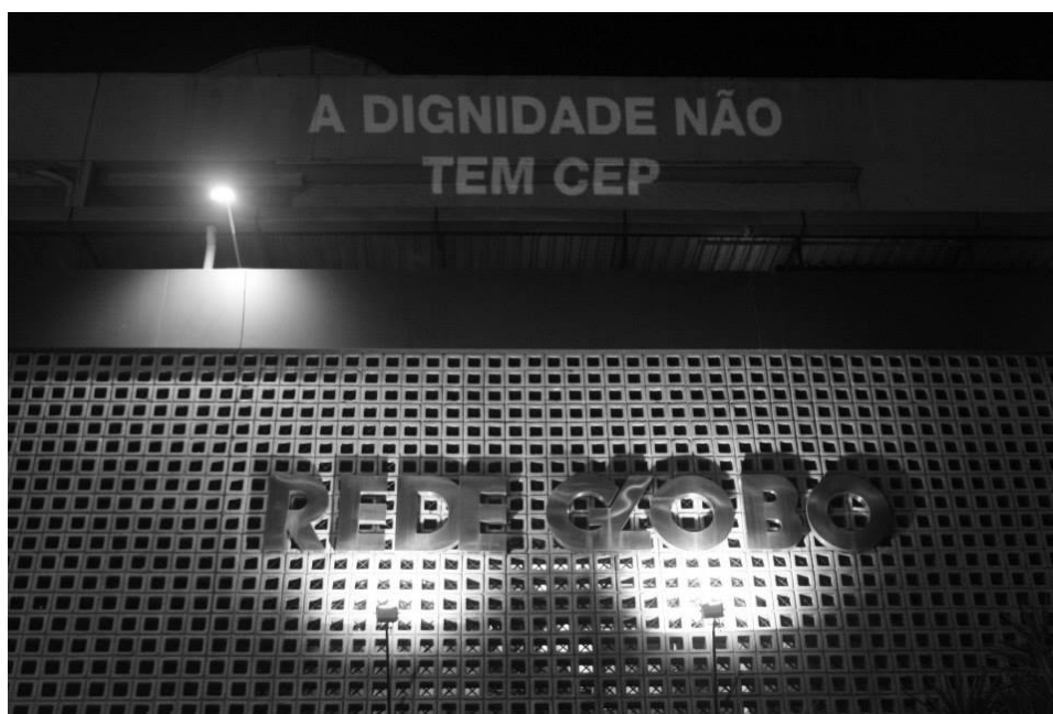
Figura 1 – Projeção na fachada da Rede Globo (RJ)

O coletivo Projeção (2015, online ) se auto define como: “LUZ, REFLEXÃO, MOBILIZAÇÃO. Somos um coletivo que investe na ocupação de espaços públicos como forma de expressão política”. Assim, por diversas vezes, marcas estão involuntariamente envolvidas nas ações do coletivo, que transforma a manifestação dessas marcas por meio de projeções em fachadas de empresas e de prédios públicos, backdrops de eventos, veículos de transporte público, dentre outros (figura 1).