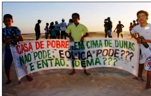
Figura 1. Cartaz de protesto contra a implantação de usina eólica na região das dunas.

A postura do Estado na elaboração e aplicação de políticas públicas gera contradições no seio do território alvo da mesma, pois pode contemplar um segmento da sociedade em detrimento do outro. Em relação a política energética adotada pelo governo federal, estados como o Rio Grande do Norte, por exemplo, possui suas incoerências, tal como a elucidada na Figura 1.