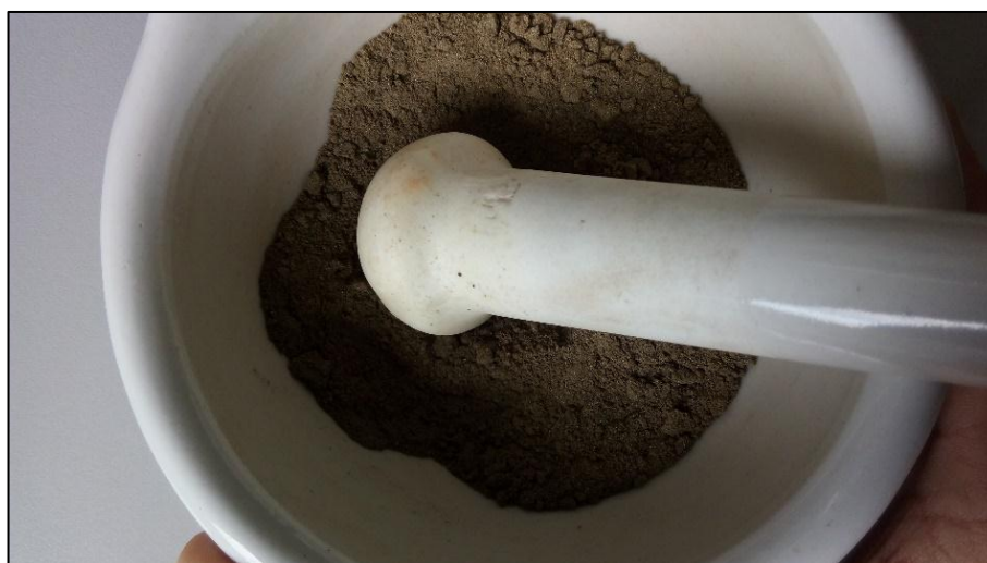
Figura 4 – Maceração de clínquer produzido com substituição de argila por RCV beneficiado

Tosta, Souza e Silva (2007) elucidam, para produção do cimento Portland, as matérias-primas compõem-se de aproximadamente 80% de carbonato de cálcio ( \text{CaCO}_3 ), 15% de dióxido de silício ( \text{SiO}_2 ), 3% de óxido de alumínio ( \text{Al}_2\text{O}_3 ), além de outros constituintes em quantidades menores. Dessa forma, para produção do clínquer fixou-se a proporção de 80% de calcário calcítico e 20% de resíduo de telha cerâmica vermelha, em substituição a argila utilizada no processo convencional de fabricação do cimento Portland. As matérias-primas foram misturadas para realização da queima em mufla por um período de três horas a temperatura de 1200 °C, como foi realizado por Silva (2015). O clínquer, produto da queima, foi macerado com almofariz e pistilo de Ágata, obtendo-se um pó fino como apresentado na Figura 4.