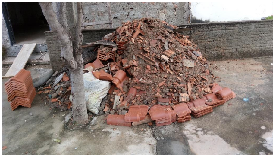
Figura 2 – Entulho de obras residenciais.