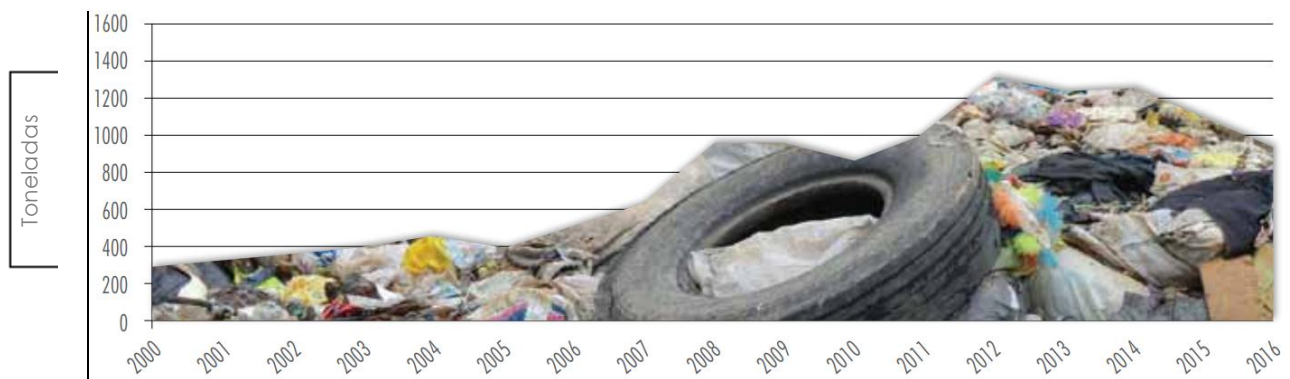
Figura 1 – Evolução dos resíduos coprocessados em fornos de cimento (2000-2016) em toneladas

Fonte: Adaptado de Associação Brasileira de Cimento Portland - ABCP (2017a)