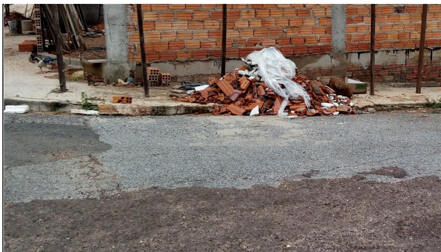
Figura 3 – Entulho de obras comerciais.