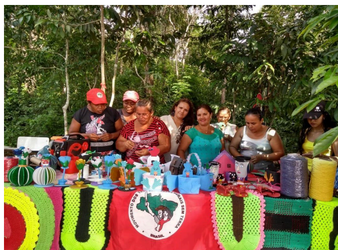
Figura 04: Comercialização do artesanato do coletivo Fryda Kahlo.

No que tange à inserção comunitária e à geração de renda, o grupo confecciona cestas temáticas e lembranças artesanais em alusão a datas comemorativas, fomentando a economia solidária e afetiva no local. As artesãs também participam ativamente dos eventos calendarizados do município, tais como o aniversário da cidade, festas juninas, cavalgadas e programações sazonais nas praias fluviais, ocasiões em que estruturam barracas para a comercialização de alimentos. Assim, a circulação e a venda desses produtos e do artesanato configuram-se como táticas de resistência e de afirmação da identidade política desenvolvidas pelas mulheres no acampamento.