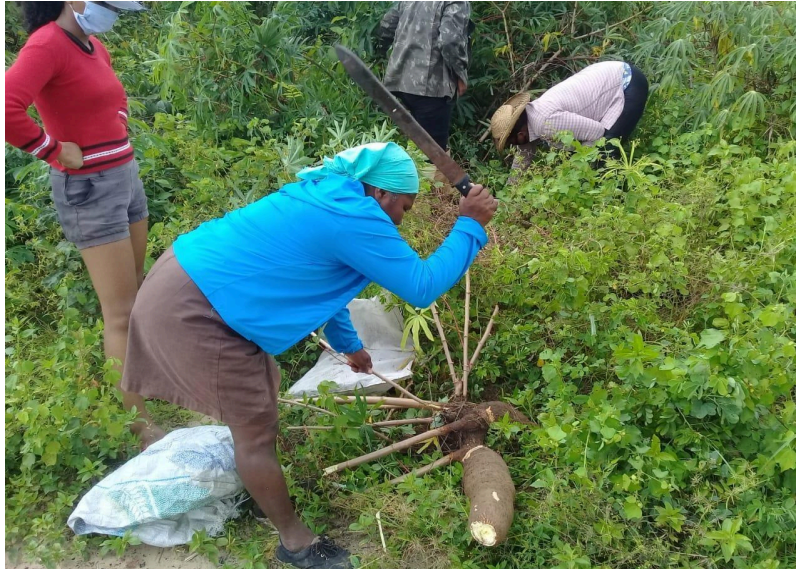
Figura 6: colheita de mandioca, 2024.

ações promovidas pelo Movimento dos Trabalhadores Rurais Sem Terra.