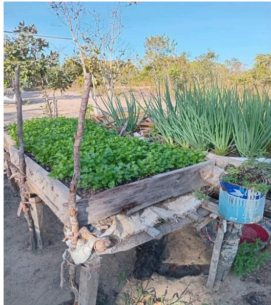
Figura 02: Quintal produtivo: Horta, Acampamento Beatriz Bandeira (TO)