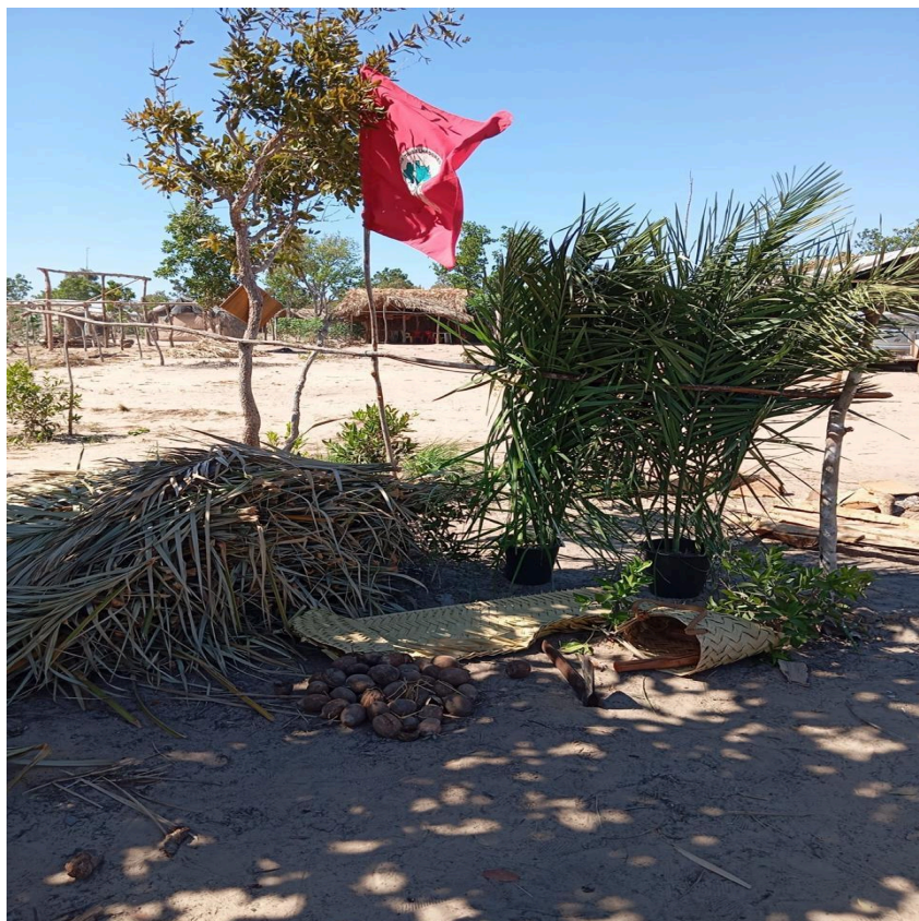
Figura 01: Acampamento Padre Josimo

Atualmente, o acampamento Padre Josimo congrega 25 famílias em resistência. Os núcleos familiares mantêm-se articulados em dois coletivos orgânicos: o coletivo de mulheres e o coletivo de juventudes. O território dispõe de infraestrutura comunitária, composta por duas casas coletivas de produção de farinha de mandioca, apiários geridos pela juventude e hortas sob a responsabilidade do coletivo feminino, além de uma produção agrícola diversificada cultivada autonomamente por cada núcleo familiar.