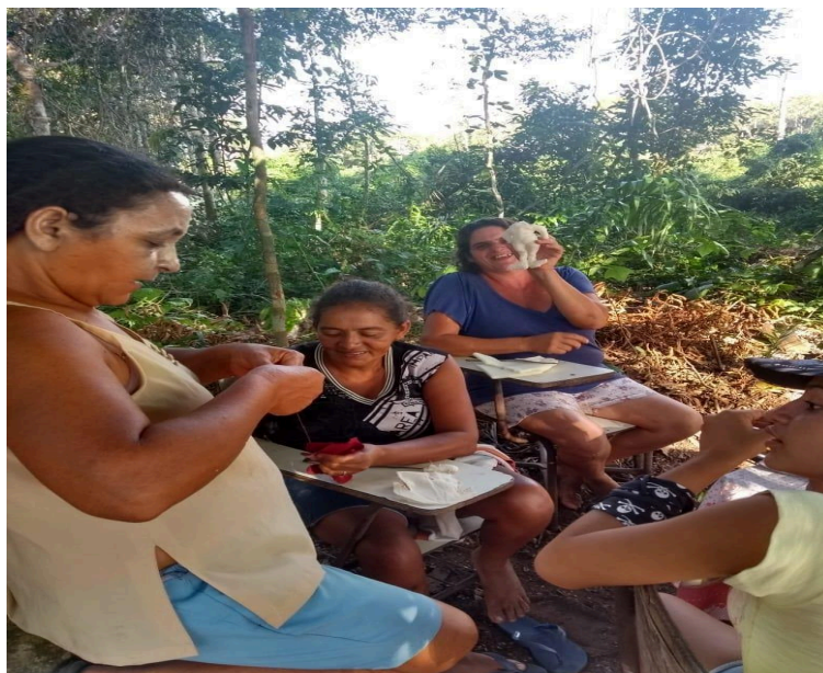
Figura 03: coletivo de Fryda Kahlo construindo peças artesanais.

Atualmente, os espaços formativos e as rodas de debate do Coletivo Frida Kahlo contam com a articulação intersetorial de profissionais de psicologia e assistência social do município de Carrasco Bonito, responsáveis pela condução de palestras direcionadas a todas as famílias acampadas. Essa rede de apoio consolida-se, ainda, por meio de oficinas pedagógicas e intercâmbios de experiências com o Centro de Referência de Assistência Social (CRAS). Nesses encontros interativos, são tensionados e debatidos temas estruturantes como diversidade cultural, os princípios da educação popular e as especificidades da saúde integral da mulher do campo