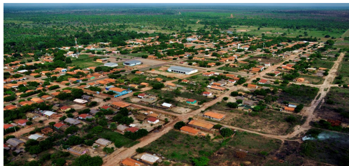
Figura: 01: Carrasco Bonito