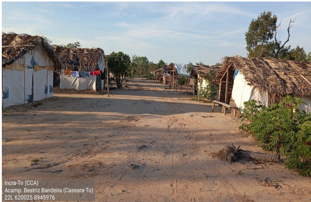
Figura 01: Acampamento Beatriz Bandeira, Caseara- To