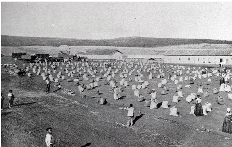
Terreiro de café na região de Campinas, em 1888, ano em que foi sancionada a Lei Áurea: mão de obra escrava movia fazendas

Mesmo após a abolição formal da escravatura em 1888, a população negra permaneceu à margem da sociedade, sem acesso a políticas públicas que garantissem sua inclusão social.