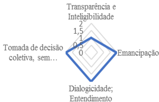
Gráfico 1. Dimensões da Gestão Social no CME/PALMAS.

Legenda: 0 – Critério não atendido; 1- Pouco atendido; 2 – Muito atendido; 3 – Totalmente atendido.