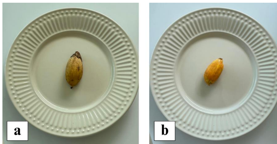
Figura 1 - Frutos do inajá íntegro e sem casca

A Figura 01 mostra o fruto de inajá fruto íntegro (a) e o fruto sem casca (b).