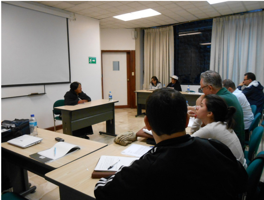
Entrevista realizada com liderança do movimento indígena. Setembro de 2014.