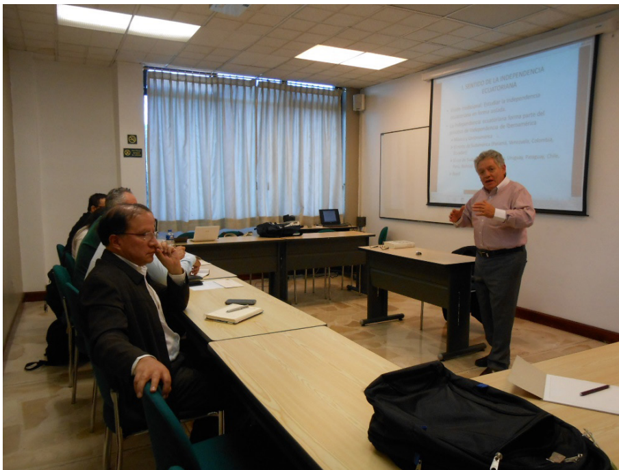
Palestra ministrada por docente da Universidad Andina Simón Bolívar sobre a contexto político do Equador como parte da pesquisa de campo. Setembro de 2014.