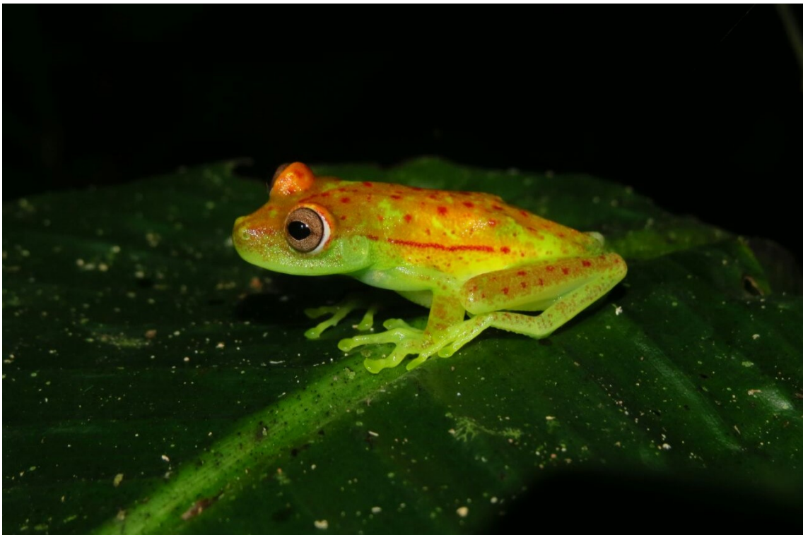
Figura 4. Foto de um exemplar de um vertebrado fluorescente, uma perereca, cujo nome científico é Boana punctata .