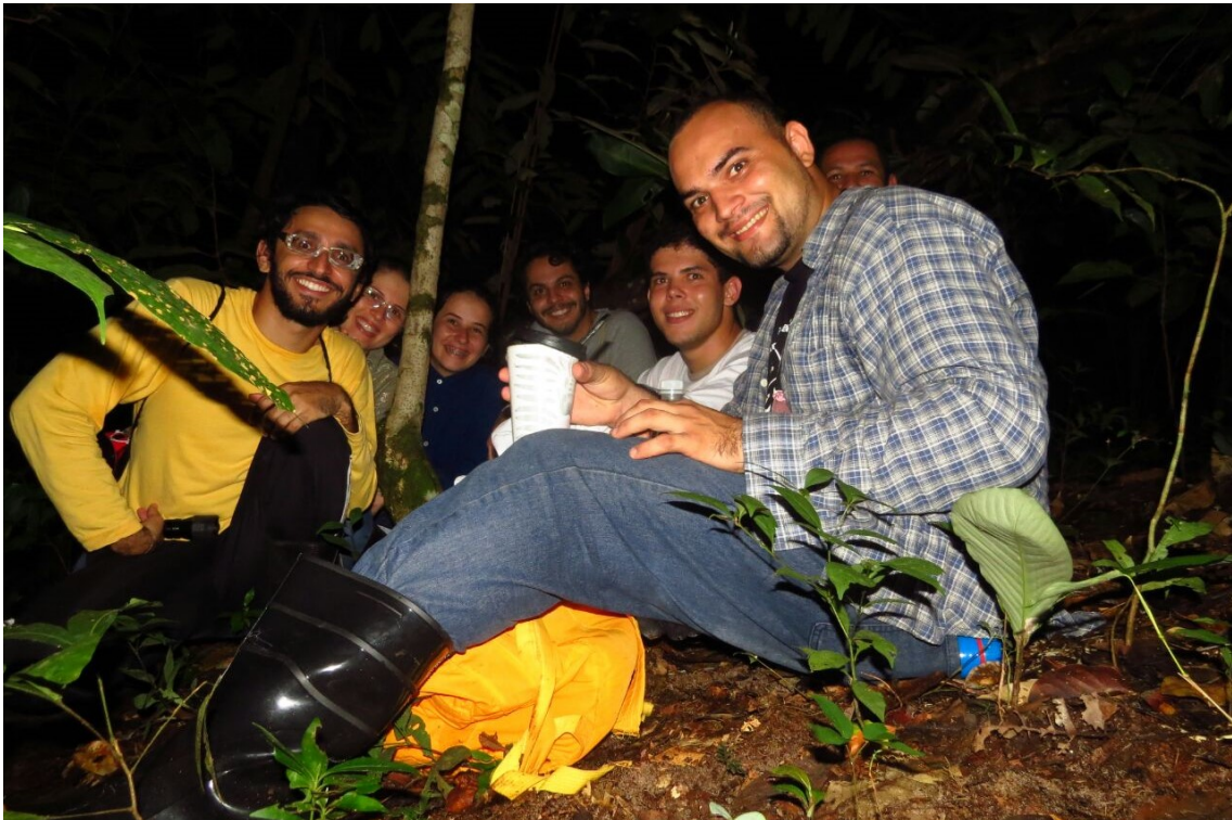
Figura 5. Parada para repor energias e continuar a trilha pelo campus. Esta trilha tem como função permitir a descoberta de novas espécies existentes ao redor no nosso ambiente de estudo, de modo a estudá-las e pesquisar mais sobre as mesmas, além de promover o interesse dos acadêmicos envolvidos no GEASTO.