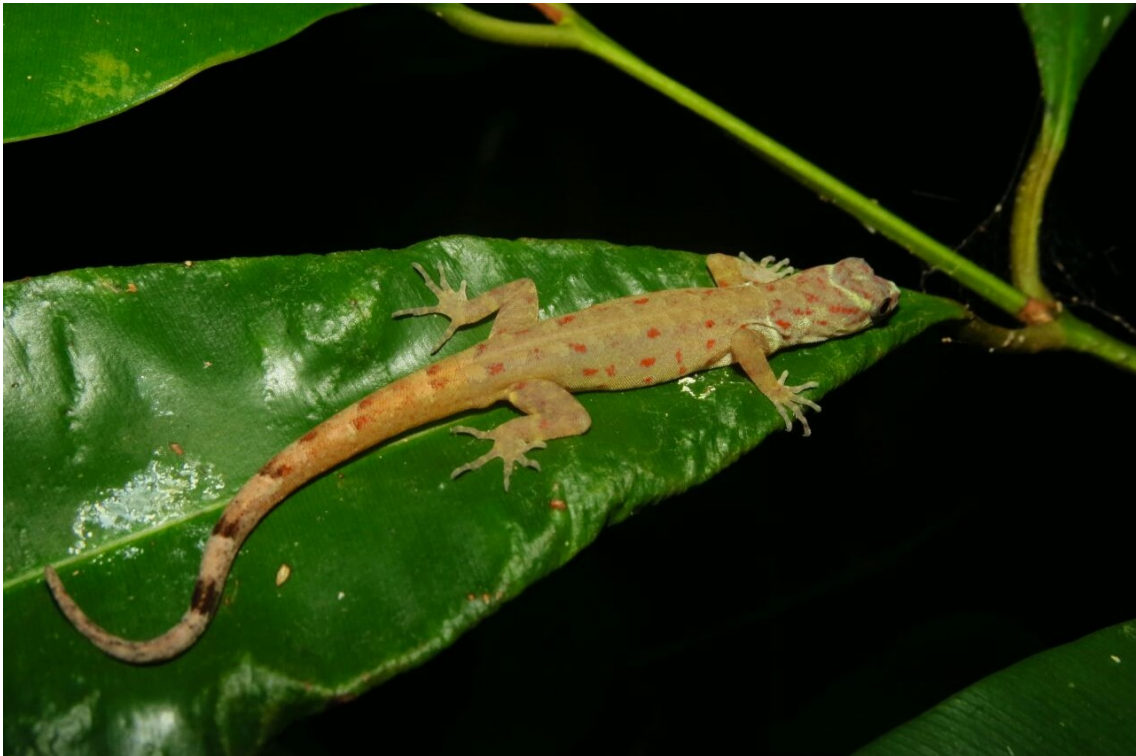
Figura 3. Foto de um exemplar de um pequeno lagarto, cujo nome científico é Gonatodes humeralis . .