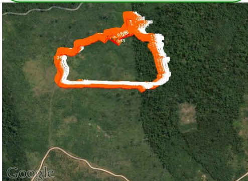
Figura 2. Mapa da trilha a ser percorrida.