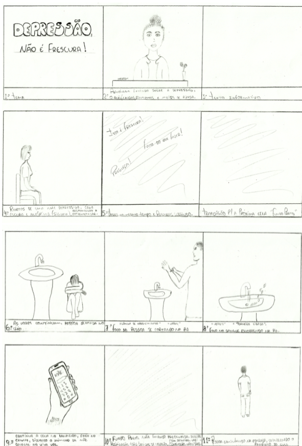
Figura 01: Storyboard do Curta-metragem