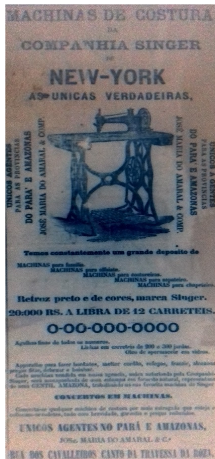
Imagem 7 – A Província do Pará, 9 jan. 1877, n. 232, p. 3.