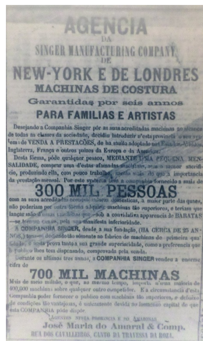
Imagem 5 – A Província do Pará, 25 mar. 1876, n. 1, p. 4