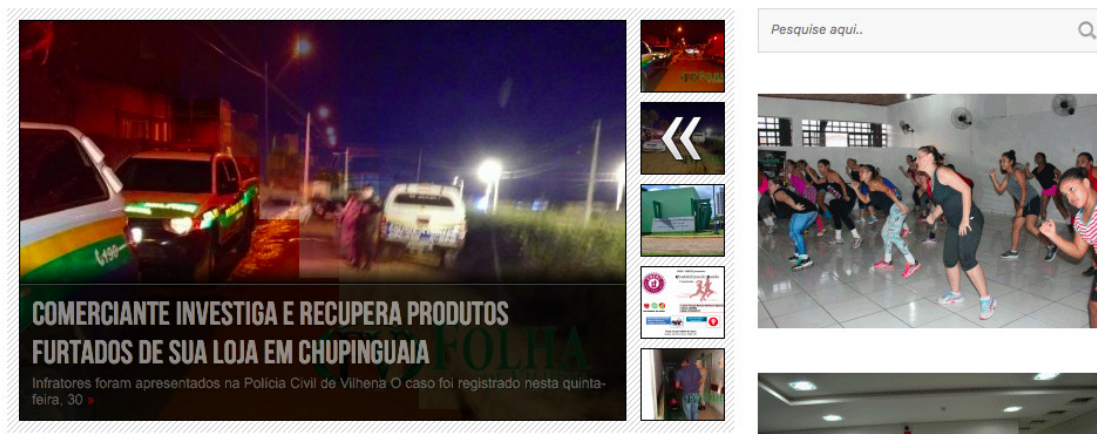
Figura 3 – Página principal do jornal Folha de Vilhena.