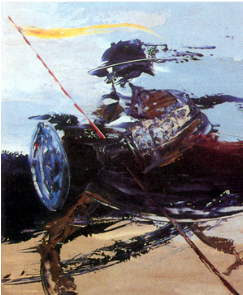
Figura 3 - Anísio Melo, Mensageiro do Apocalipse. Óleo sobre fibra, c.1985, 50 x 61cm.

Cabe destacar o talento retratístico de Manoel Borges (1944-1987), cujo estilo realista e naturalista aproxima-se mais do gênero acadêmico. Desenhista, pintor e fotógrafo, produziu intensamente nos anos 1960 e 1970. Trabalhou inicialmente na Foto Nascimento, com retoque e colorido de fotografias. Depois atuou como guia de museus e também foi professor no curso de desenho e pintura da Pinacoteca do Estado do Amazonas. Participou de diversas exposições locais, na Biblioteca Pública em Manaus (1979), no Teatro da Paz em Belém (1982), em mostras coletivas como a exposição Arte Contemporânea Amazonense no Museu de Artes de São Paulo (1967) e no Rio Sheraton Hotel, Rio de Janeiro (1983).