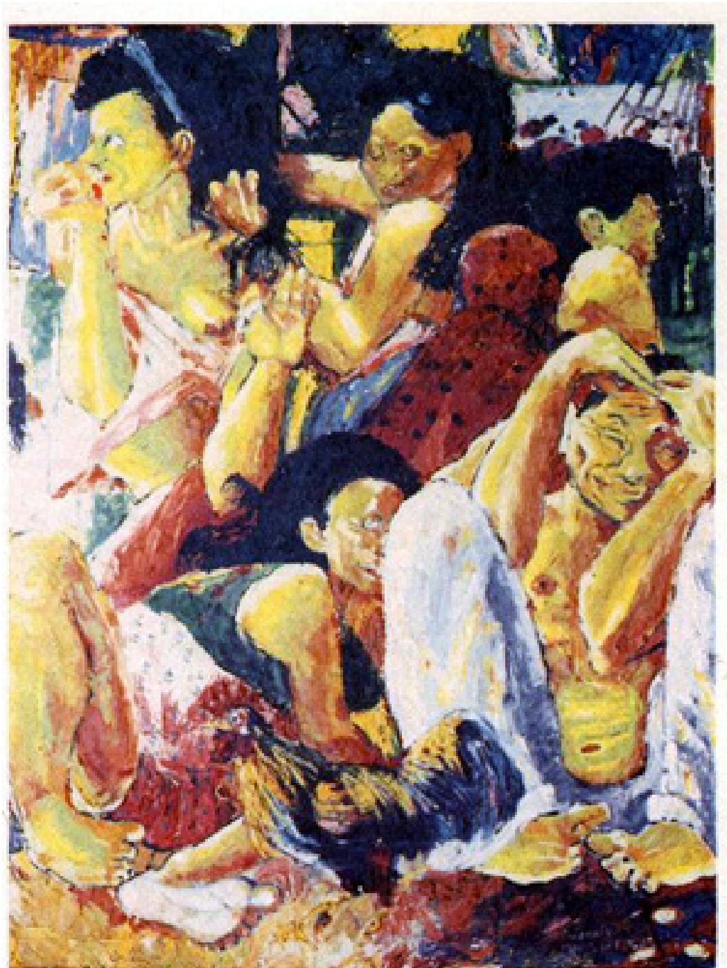
Figura 8 - Hahnemann Bacelar, Miséria. Óleo sobre tela, 1968. 98 x 77cm.

século XX. Existe uma sobreposição de corpos em várias posições. Inicialmente observamos a preocupação social do artista com a condição da mulher, pois estas são mais recorrentes em sua obra. As fortes pinceladas e o uso de cores