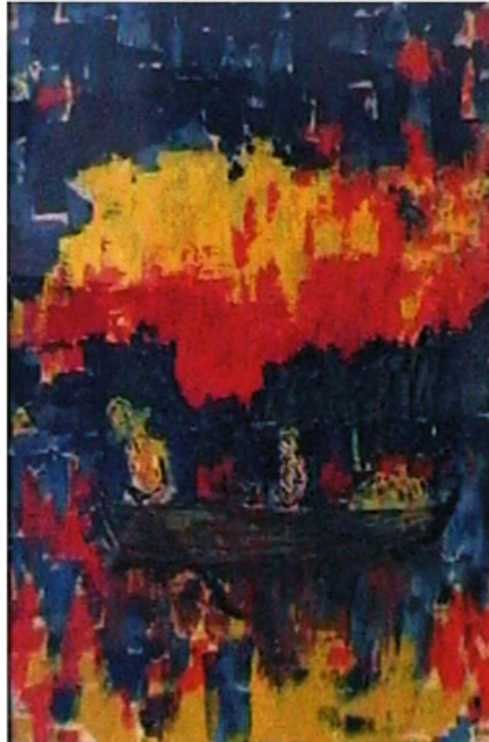
Figura 6 - Gualter Batista, Paisagem ao por-do-sol. Óleo sobre tela, 1964, 59 x 42cm.

contribuir com a arquitetura, a fotografia e o cinema.