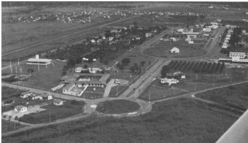
Figura 1 – Foto do núcleo urbano do projeto da colonizadora Campo Alegre.