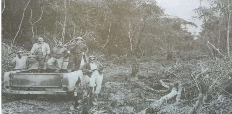
Figura 2 – Abertura da estrada “Barreira do Campo”, Fazenda Campo Alegre, atual PA-411 (out. 1968).

https://doi.org/10.20873/uft.am.2594-7494.abril2026-3