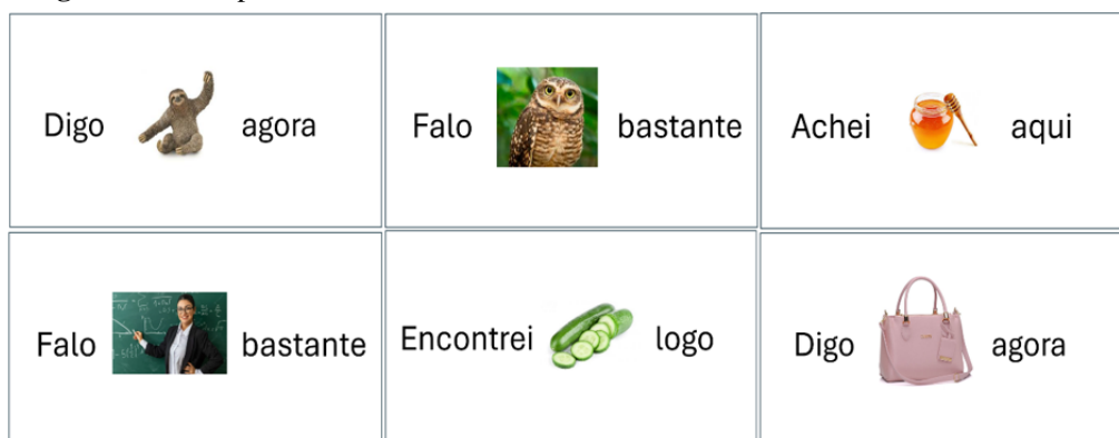
Figura 2 – Exemplos dos estímulos visuais com as frases-veículo e frases distratoras.

Na coleta dos dados, apresentou-se aos sujeitos-participantes a frase-veículo (com a estrutura Falo palavra bastante), bem como as frases distratoras (“Digo__ agora”, “Achei__ aqui” e “Encontrei__ logo”) elaboradas com a finalidade de evitar uma leitura enumerativa e que pudesse desviar a atenção dos participantes quanto a frase-veículo alvo que continha a vogal média /o/ pretônico. Desse modo, os dados foram coletados por meio da leitura tanto das frases-veículo alvo quanto das frases distratoras, sendo que essas últimas não foram consideradas na análise pleiteada aqui. Tais frases foram apresentadas aos participantes de forma aleatória, utilizando o recurso computacional PowerPoint , como ilustrado na figura 2, a seguir.