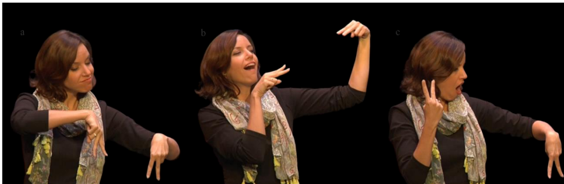
Figura 2: Divergência entre personagens

Classificadores utilizados no videopoema para narrar respectivamente a) o encontro de duas pessoas, b) o mútuo reconhecimento e, por fim, c) a inversão de personalidade delas.