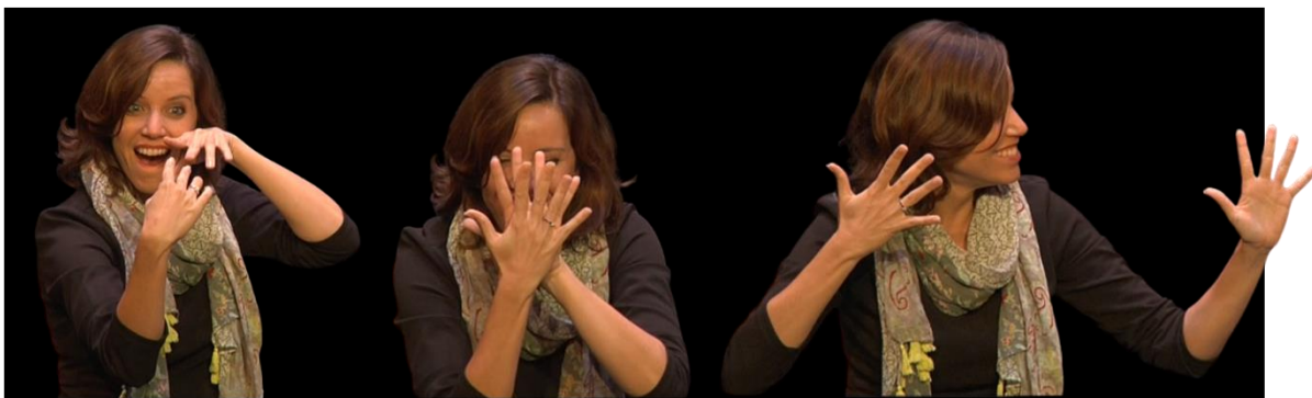
Figura 6: Conciliação entre as personagens mediante aceitação de similaridades convergentes

Percurso de melhoria, entre 01:42 e 01:57, no qual o parâmetro Movimento passa a ser configurado com espacialidade ampliada, temporalidade alongada, tonicidade fraca e andamento refreado.