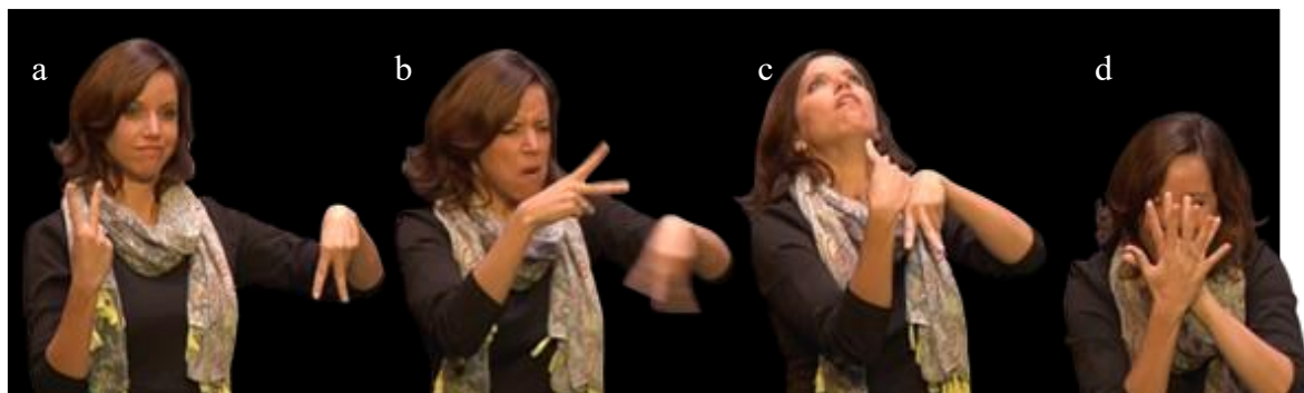
Figura 3: Retaliações gradativas entre personagens de V&V

Classificadores utilizados no videopoema para narrar respectivamente a) os programas de retaliação que b) graduam-se cada vez mais até que haja c) a saturação da agressividade e, por fim, d) a suspensão do percurso de pejoração. Fonte: Elaboração própria.