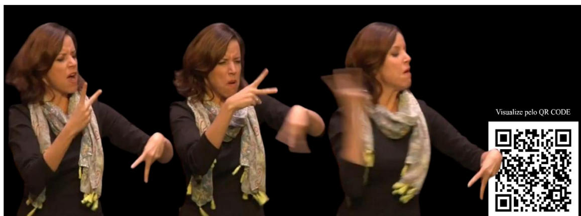
Figura 4: Aceleração do andamento e redução das durações na manifestação de V&V

Entre o intervalo de 01:24 e 01:39, durante a sinalização do aumento de tensão no conteúdo, os sinais são acelerados à precipitação.