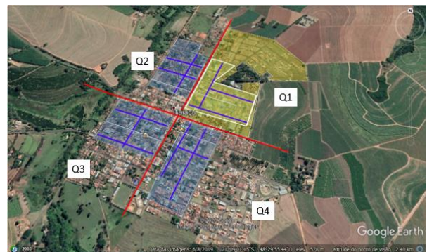
Figura 1 - Elementos básicos para visualização de imagens de satélite da cidade de Taiaçu-SP-Brasil, na identificação dos quadrantes (Q1, Q2, Q3 e Q4). O quadrante 1 em amarelo identifica a área total urbana do quadrante, a linha tracejada branca denota a área amostral/quadrante, com as três vias públicas identificadas em azul. Nos outros quadrantes identifica-se apenas a camada selecionada da área amostral/quadrante com as três vias públicas.

quadrante, utilizando-se a ferramenta “polígono”. Posteriormente delimitou-se aleatoriamente a área amostral composta por 12 hectares (ha) em cada quadrante. Na sequência, e de forma aleatória, identificou-se três ruas na área amostral, em cada quadrante, por meio da ferramenta “caminho”, a qual permite armazenar o comprimento de cada rua identificada e o número de elementos arbóreos identificados, através da contagem por observação visual da imagem, propiciada pelo software, vista de cima (Figura 2), num ângulo em relação ao solo de 90°, através da ferramenta de aproximação do distanciamento em relação ao solo, localizada do lado direito da área de trabalho do software aberto, como mostra a Figura 01, acionando o “+” para aproximação, e “-“ para afastamento.