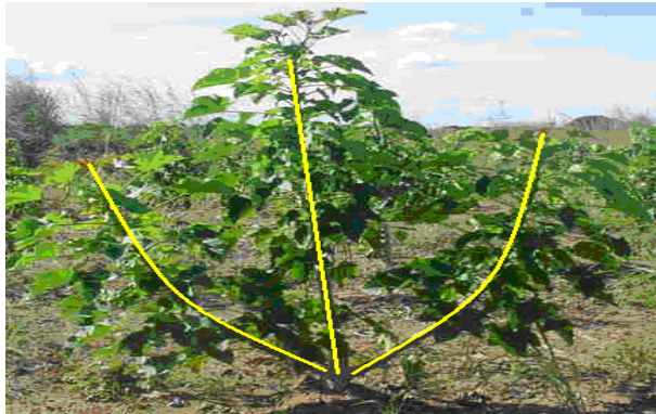
Figura 1 - Planta de pinhão manso contendo três ramos (sendo um considerado o principal e dois secundários e opostos) formando um tridente.

Diversas metodologias utilizam-se da medição das dimensões comprimento (C) e largura (L) das folhas para quantificação da área foliar. Onde o comprimento é definido como a distância entre o ponto de inserção do pecíolo no limbo foliar e a extremidade oposta da folha e a largura como a maior dimensão perpendicular ao eixo do comprimento (Monteiro et al., 2005), obtidos com o auxílio de uma régua milimetrada, conforme mostra a Figura 2.