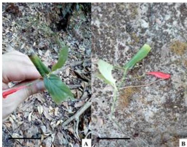
Figura 1 - Registro de Ruellia brevifolia em ambiente natural de vegetação de Mata Ripária (A) serrapilheira e em (B) sobre maciços calcários. Barras: 30 cm.

Na figura 1, está apresentando um indivíduo de R. brevifolia em período de floração na área de estudo.