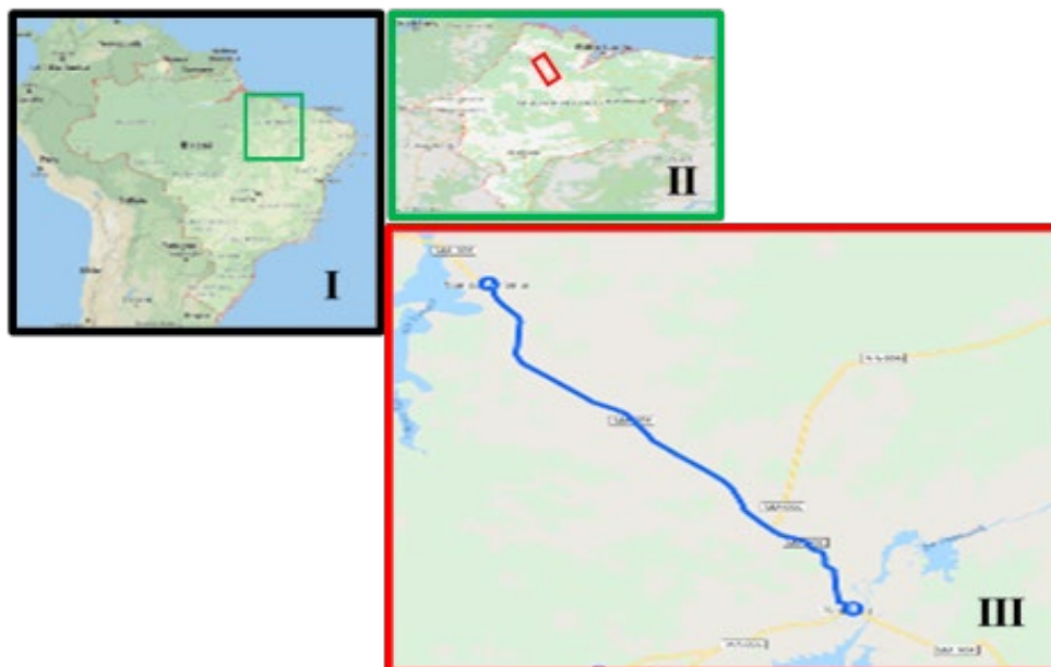
Figura 1 - Localização da área de estudo. I) Brasil; II) Estado do Maranhão; III) MA-106, trecho de Santa Helena a Pinheiro

O trecho percorrido para o estudo liga as cidades de Santa Helena – MA a Pinheiro – MA e têm aproximadamente 42 km de extensão, com acostamento em alguns pontos, geometria ruim e quase não apresenta sinalização, a velocidade máxima permitida é de 80 km/h, mas não há radares que controlem essa velocidade, todos os tipos de veículos podem trafegar por essa rodovia, sem restrição (Figura 1).