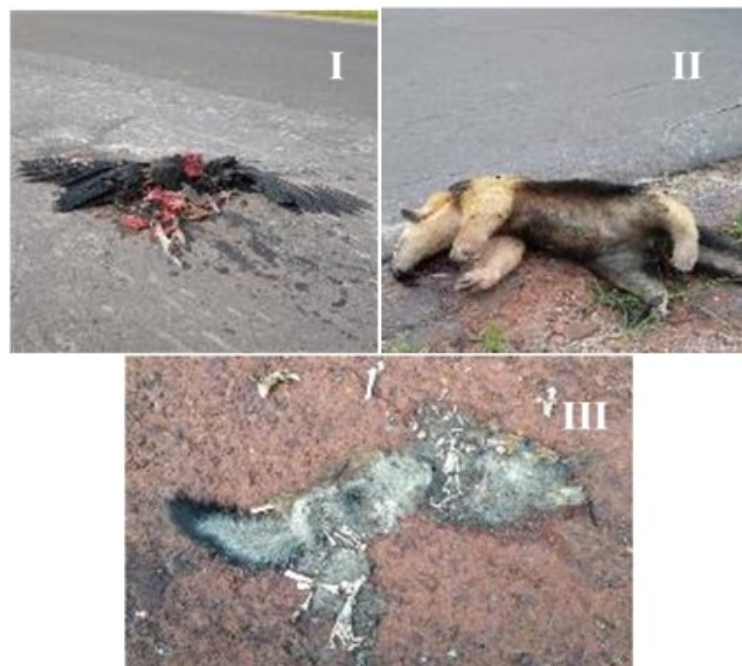
Figura 3 - Estágios de decomposição, I) Inicial; II) intermediário; III) avançado.

quando já apresentava cheiro forte e característico de putrefação; e avançado: também apresentando cheiro forte e característico de putrefação, mas já bem deformado por ação de decompositores por vezes apresentado só pele e ossos (Figura 3).