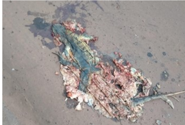
Figura 2 - Carcaça de lagarto na pista (possível evidenciar reatropelamentos).

Desta maneira foram realizadas considerações acerca do estado de decomposição, dividido em inicial: quando não apresentava cheiro característico de putrefação, e ainda era possível observar os músculos e sangue; intermediário: