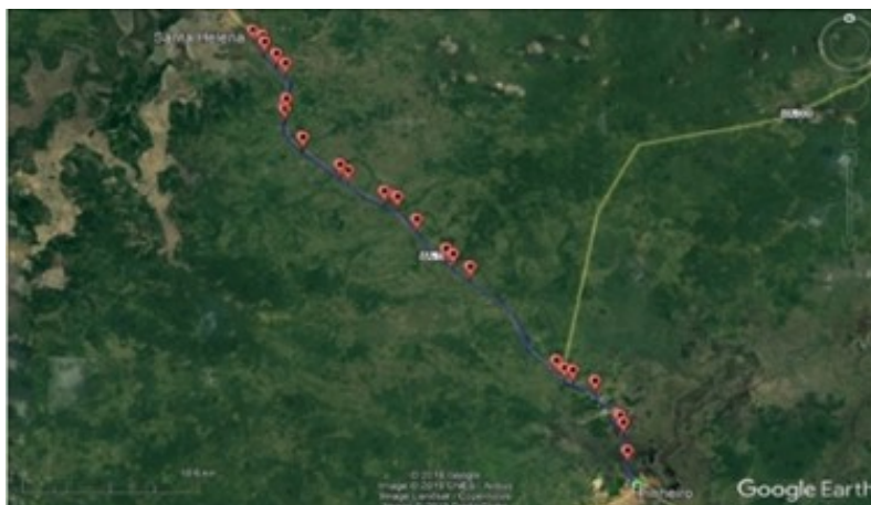
Figura 6 - Georreferenciamento dos animais silvestres encontrados atropelados na Rodovia Estadual MA-106, trecho que liga os municípios de Santa Helena e Pinheiro, de janeiro de 2019 a maio de 2019.

O georreferenciamento apresentado na figura 6 pode se tornar uma ferramenta valiosa para se estabelecer medidas mitigadoras, pois com seu auxílio pode-se verificar em quais pontos e trechos da rodovia encontram-se as maiores agregações e casos de atropelamento da fauna silvestre onde cada ponto representa um animal morto por atropelamento.