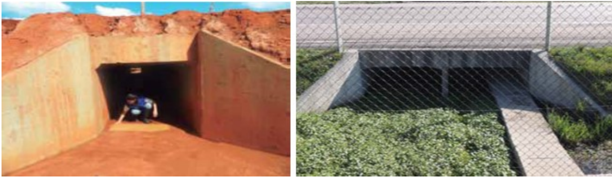
Figura 7 - Exemplos de passagem para fauna, I) passagem tipo caixa; II) Passagem de fauna subterrânea mista na rodovia BR-392/RS.

Medidas como essas veem contribuindo para a diminuição de animais mortos por atropelamento na Reserva Ecológica do Taim no Rio grande do Sul na BR-471/RS, onde no ano de 2012, 375 animais morreram atropelados na rodovia já no ano de 2017 apenas 63 animais perderam a vida na estrada. Desde 1996 em parceria com o IBAMA e ICMBio o Departamento Nacional de Infraestrutura de Transportes (DNIT), vem implementando um sistema de proteção à fauna, foram instaladas passagens de fauna e telas direcionadoras a fim de impedir atropelamentos, sinalização educativa e de advertência aos motoristas e redutores de velocidade nos trechos sem telamento (DNIT, 2012).