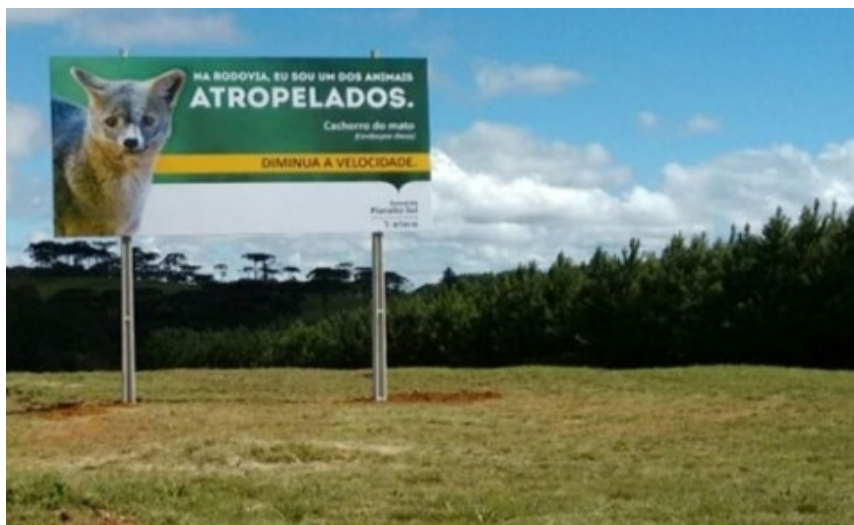
Figura 8 - Exemplo de outdoors com elementos informativos em trechos da BR-116.

Para Oliveira e Latini (2013), em rodovias, o acesso ao público-alvo se torna mais difícil para trabalhos de Educação Ambiental. Desse modo, o acesso pode ser através de blitz promovidas pela Polícia Rodoviária ou Florestal, com distribuição de materiais didáticos em pedágios e em postos de abastecimento. A implantação de outdoors com elementos informativos pode representar grande contribuição para chamar a atenção dos motoristas para o problema e para enfatizar informações importantes (Rodrigues e Colesanti, 2008). Como no exemplo da figura 8, onde foram instalados outdoors em locais com maior índice de atropelamentos na BR-116 em Santa Catarina (ND, Florianópolis, 2015).