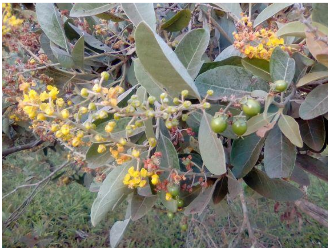
Figura 2 - Indivíduo de Byrsonima verbascifolia em período de floral e frutificação no mês de agosto de 2020.

Na Figura 2, está apresentado um indivíduo de B. verbascifolia em período de floração apresentando frutos no mês de agosto de 2020, em área de frutíferas localizado no Instituto Federal Goiano, Campus Rio Verde, GO, Brasil.