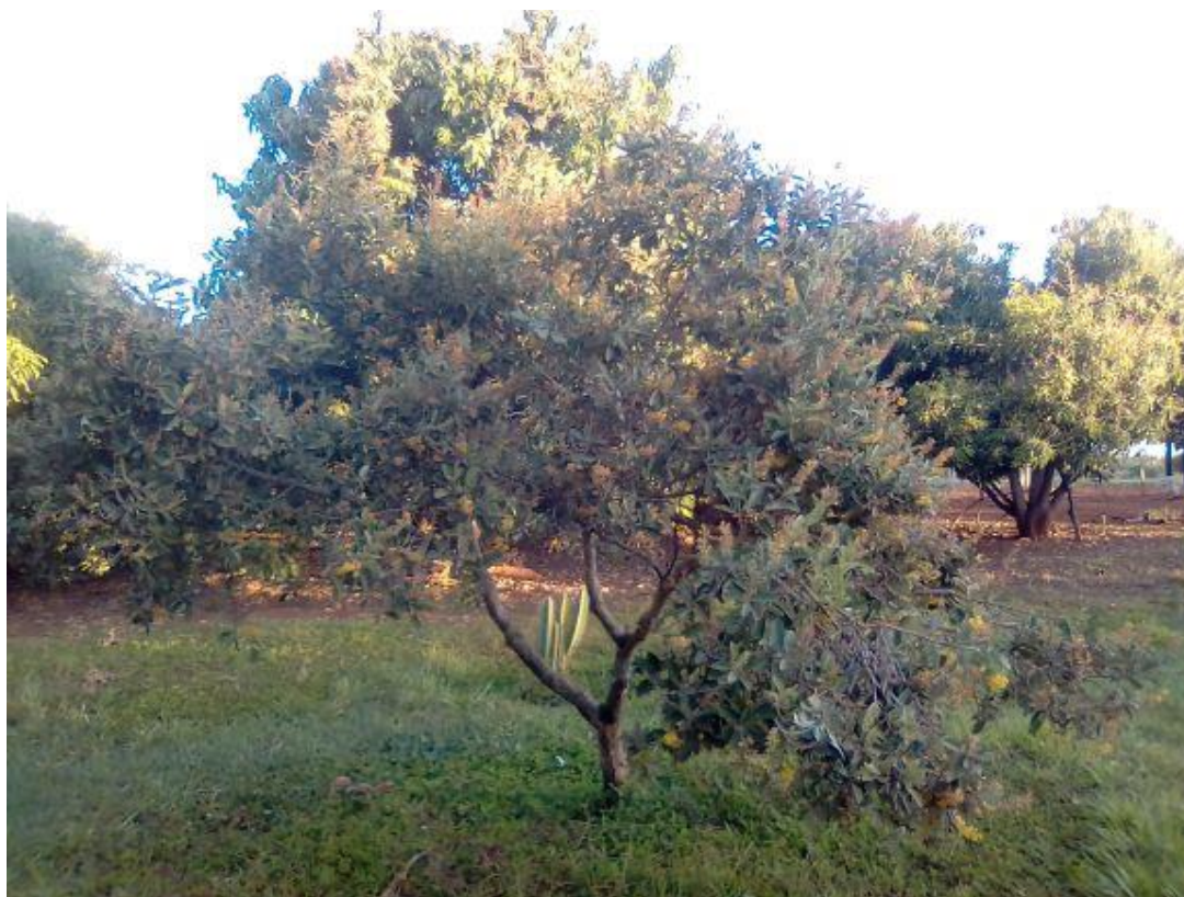
Figura 1 – Indivíduo de Byrsonima verbascifolia apresentando inflorescências.

Na Figura 1, está apresentado um indivíduo de B. verbascifolia em período de florescência em agosto de 2020 em área de frutíferas localizado no Instituto Federal Goiano, Campus Rio Verde, GO, Brasil.